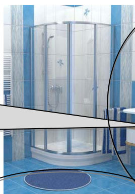
SUPERNOVA - SKCP4 - zdjęcie produktu w wykonaniu Satyna+Transparent