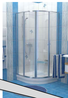
SUPERNOVA - SKCP4 - 20% wykonaniu Satyna+Transparent